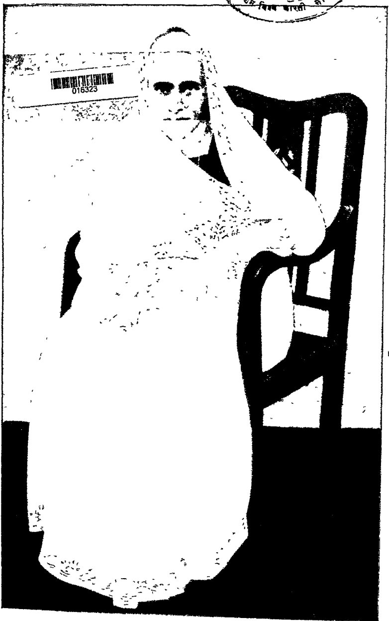
स्वर्गीय मूर्तिदेवी, मातेश्वरी साहू ज्ञान्तिनसाद जैन